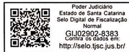
RODRIGO JOSE MULLER Escrivão de Paz - Interino

Documento impresso por meio eletrônico. Qualquer rasura ou indicio de adulteração será considerado fraude. O espaço abaixo e o verso estão reservados às anotações e/ou Averbações.